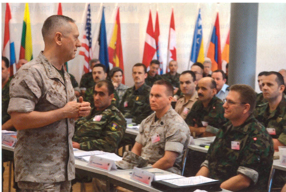
General James Mattis, SACT, spricht zu den Teilnehmern des PfP-NCO-Kurses in Luzern.

Die Kurse sind Teil eines Massnahmenpaketes des NATO/PfP-NCO-Development-Programms, welches der gestiegenen Bedeutung des Unteroffiziers als Leader in den verschiedenen Operationen der NATO Rechnung trägt. Die Ausbildung zielt darauf ab, höhere Unteroffiziere auf ihren Einsatz in einem multinationalen und multi-