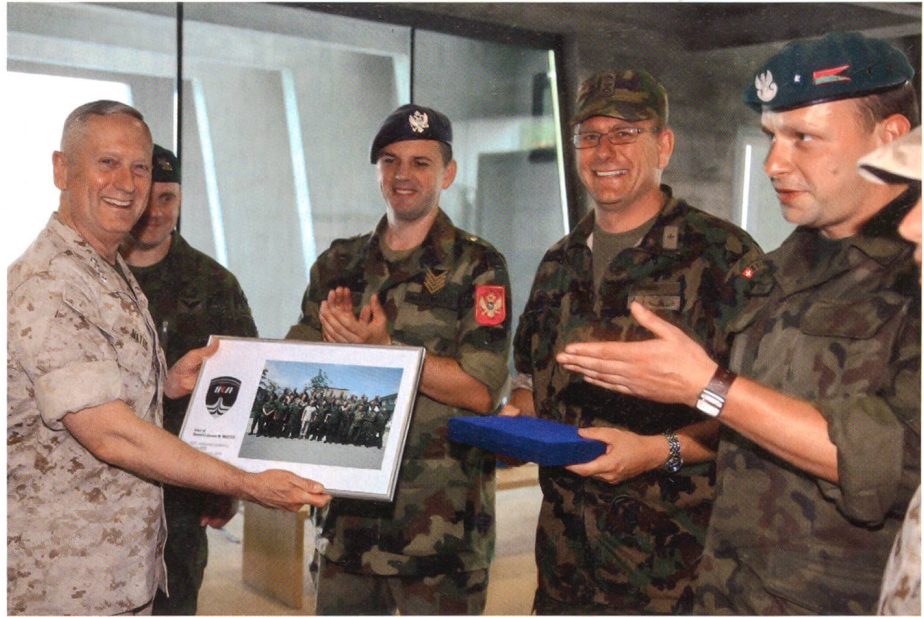
General James Mattis, SACT, erhält von den Teilnehmern ein Erinnerungsfoto.

In einer Ansprache an die Kursteilnehmer mit anschliessender Diskussion unterstrich General Mattis, ein hochdekorierter 4-Sterne-General des US-Marine-Korps mit Einsatzerfahrung im Golfkrieg, in Afghanistan und Irak, die Bedeutung des Unteroffiziers (NCO) in den laufenden und