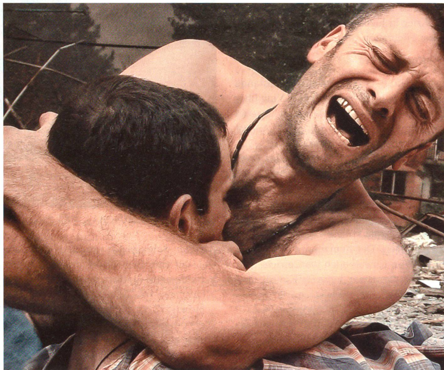
In der Stadt Gori hält ein Mann einen getöteten Bruder im Arm.