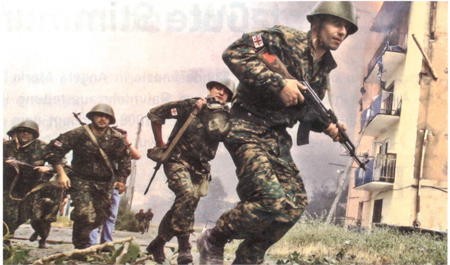
Georgische Infanteristen in der Stadt Gori. Es dürfte sich um ein gestelltes Bild handeln. Der zweite Füsilier trägt das Gewehr untergehängt, der dritte gar am Rücken. Man beachte die glänzenden Helme und die weissen Abzeichen an den Oberarmen.

Am vierten Kampftag, am 11. August, stiessen russische Panzerspitzen ins georgische Kernland vor. Von Abchasien aus nahmen sie in Grenznähe die Stadt Sugdidi ein. Dann eroberten sie die Ortschaft Senaki, die 40 Kilometer von Abchasien entfernt