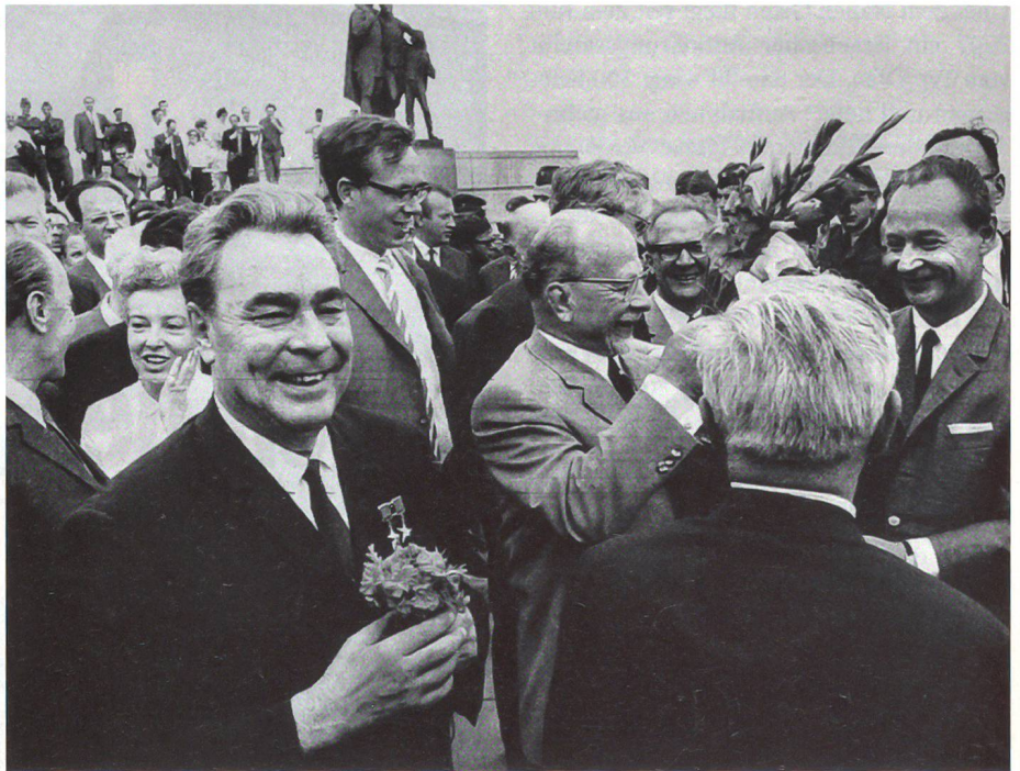
Bratislava, Anfang August 1968 – ein politisches Bild, das täuscht: Links der sowjetische Parteichef Leonid Breschnew, der kurz darauf den Einmarsch in die Tschechoslowakei anordnete, in der Mitte der DDR-Staats- und Parteichef Walter Ulbricht, rechts der tschechoslowakische Parteivorsitzende und Reformler Alexander Dubcek.

Anfang Januar 1968 hatte die Moskauer Parteispitze eher wohlwollend zugehört, als Alexander Dubcek, die Leitfigur und der Kopf der Prager Reformer, den Altstalinisten Antonin Novotny an der Spitze der Kommunistischen Partei der