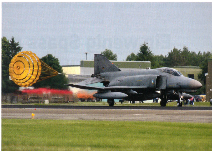
Landung des Phantoms F-4F mit Bremsschirm in Neuburg.

Am 12. Juni 2008 fand der offizielle Übergang mit einem militärischen Festakt auf dem Fliegerhorst Neuburg statt. Dem besonderen Anlass Rechnung tragend, verabschiedeten sich die Phantoms mit beeindruckenden Vorbeiflügen am Himmel über Neuburg, dazu erhielt eine Phantom zum Abschied eine schöne Sonderbemalung. Das neue Kampfflugzeug des JG 74, der moderne Eurofighter, wurde ebenfalls gebührend vorgestellt und vorgeführt. Das JG 74 hat zusammen mit dem JG 71 in Wittmund den NATO-Luftverteidigungsauftrag QRA (Quick Reaction Alert) und stellt somit die sogenannte Alarmrotte, die während 365 Tagen im Jahr, rund um die Uhr in Alarmbereitschaft steht und bei einem Alarm innerhalb von 15 Minuten in der Luft sein muss. Der Eurofighter wird nun bei der Deutschen Luftwaffe erstmals für diese Aufgabe eingesetzt, was ein weiterer wichtiger Meilenstein beim Einfüh-