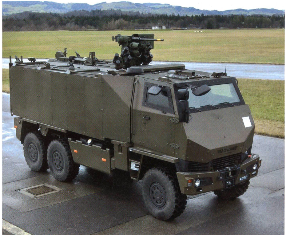
Mit dem Rüstungsprogramm lehnte der Nationalrat den Kredit für den Duro IIIP ab.