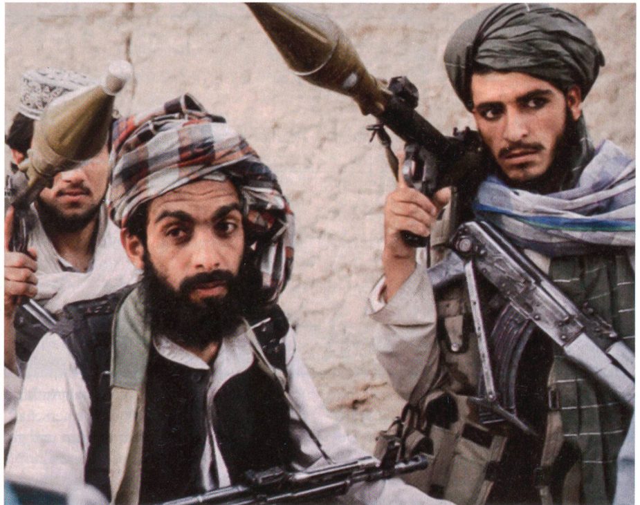
Eine rare Aufnahme von Taliban-Kämpfern: Zwei tragen panzerbrechende Waffen.

Das Gefecht dauerte bis zum anderen Morgen. Zehn Soldaten starben, 21 wurden verletzt, zum Teil schwer. Viele waren aus nächster Nähe erschossen und ausgeraubt worden. Im Hauptquartier von Kabul urteilte ein erfahrener Truppenführer: «Die Franzosen haben das Umfeld völlig unterschätzt. Es war ihnen nicht klar, dass sie in den Krieg zogen. Die französischen Streit-