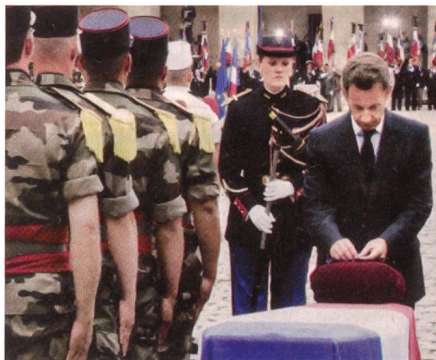
Sarkozy bei der Trauerfeier in Paris.

kräfte müssen Ausbildung, Vorbereitung, Vorgehen und Ausrüstung gründlich überprüfen, wenn sie keine solchen Verluste mehr erleiden wollen.