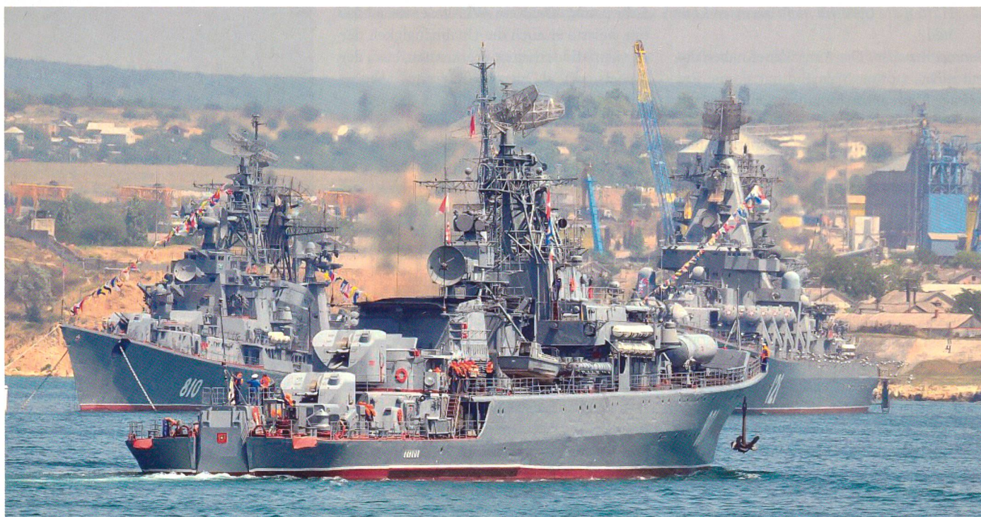
Zwei der drei an der Aktion gegen Georgien beteiligten russischen Kriegsschiffe sind hier im Hafen von Sevastopol vor Anker erkennbar, nämlich hinten links der Raketenzerstörer 810 «Smetlivyi» der «Kashin»-Klasse und hinten rechts der Raketenkreuzer 121 «Moskva» der «Slava»-Klasse. Vorne ist ferner die Raketenfregatte 801 «Ladnyi» der «Krivak II»-Klasse sichtbar.

Wenn schon, sagen einige, liegt der Fehler beim Westen selber. Natürlich, diese Wortwahl kommt uns bekannt vor. Wenn