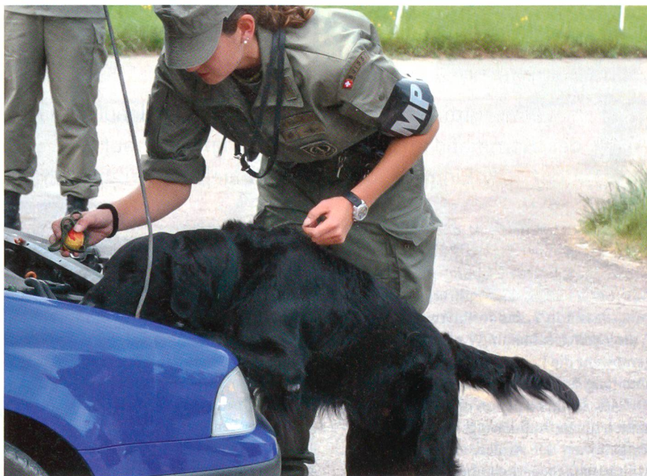
Hunde sind unentbehrlich für die Militärpolizei.

Wie eine solche Unterstützungsoperation aussähe, brachten die Fachleute der «Plattform» anhand des «Szenario Flughafen Zürich» zu Papier. Bei der Auswahl führte nicht der Zufall Regie; mit dem Verschwinden der Alarmformationen tauchten bei den zivilen Verantwortlichen altvertraute Sorgen wieder auf: Was tun, wenn unmittelbar Anschläge auf die Zivilluftfahrt drohen? Die Kantonspolizei Zürich könnte binnen kurzem auf 50 Militärpolizisten zählen und