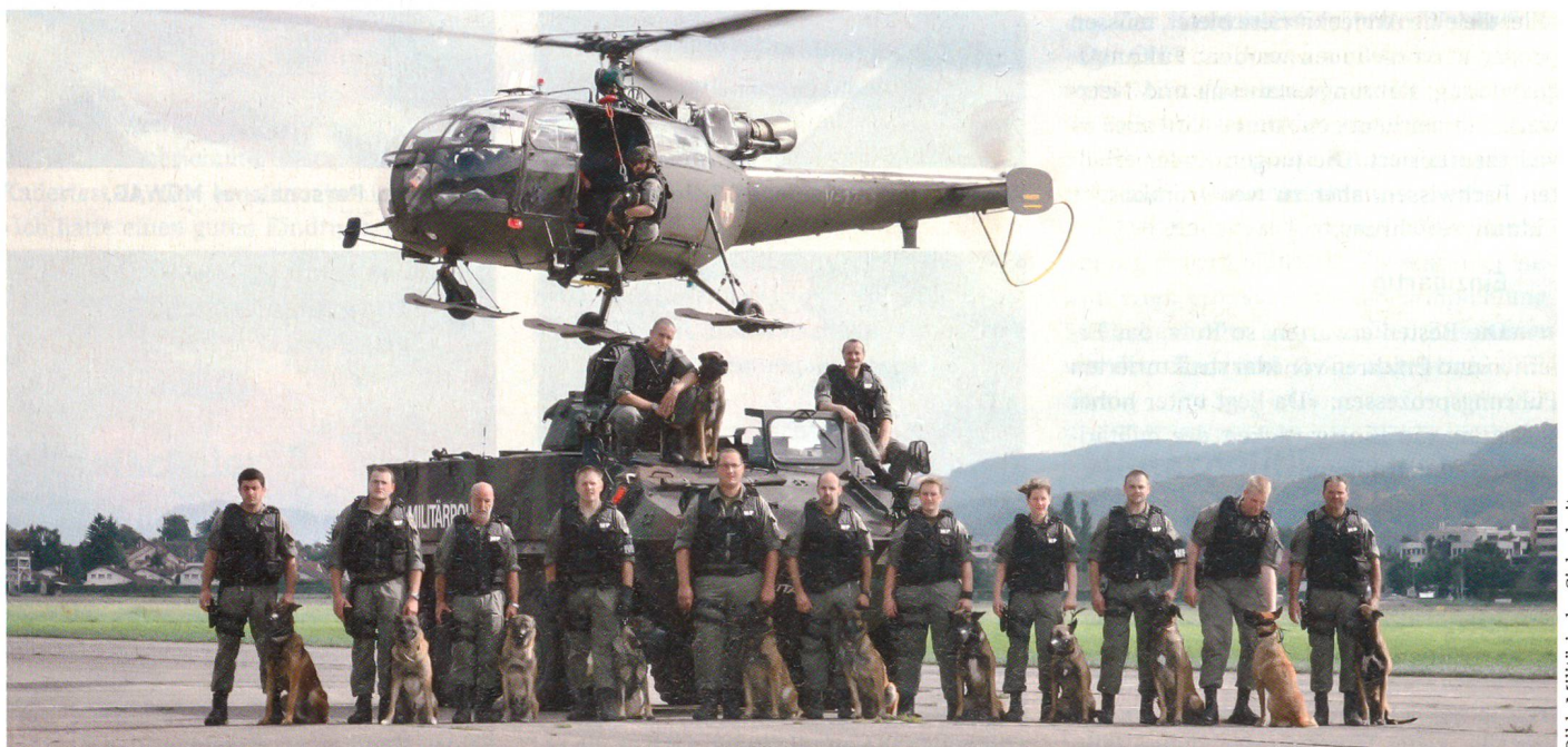
Spektakuläre Militärpolizei im Einsatz mit Helikopter.

Die subsidiären Sicherungseinsätze kennt die Öffentlichkeit besser, meist samt den Decknamen der Operationen. Seit der Bundesrat 2001 entschied, zum Stopfen der von USIS, von der Untersuchung des Systems der Inneren Sicherheit der Schweiz, auf Seiten des Bundes offen gelegten Lücke diene die Armee, wuchsen die Lasten der Militärischen Sicherheit gewaltig.