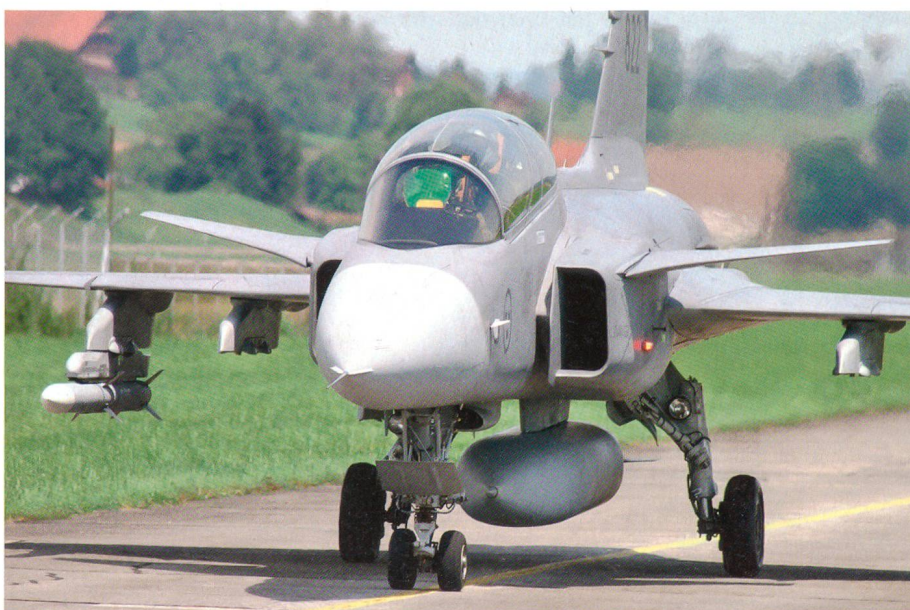
Der Gripen auf der Rollbahn in Emmen.