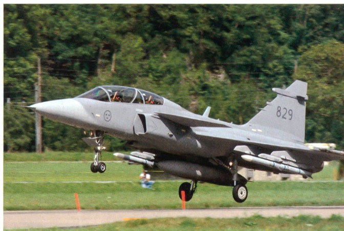
Start in Meiringen.