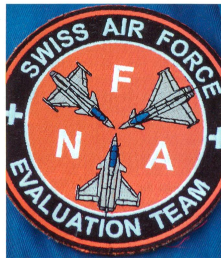
Emblem Evaluation Team.