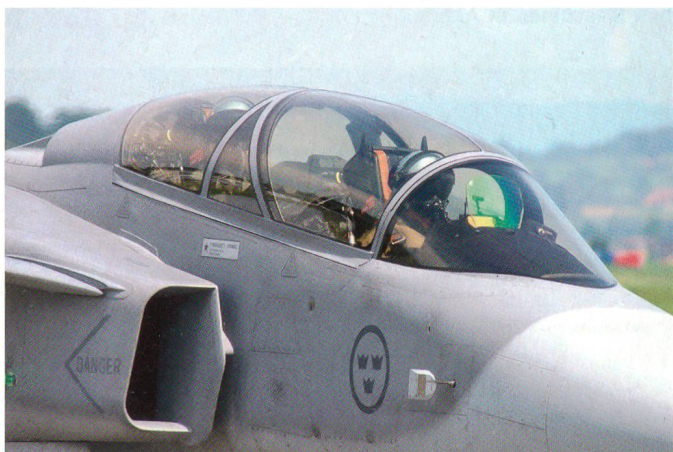
Zwei Flieger im Gripen-Cockpit.