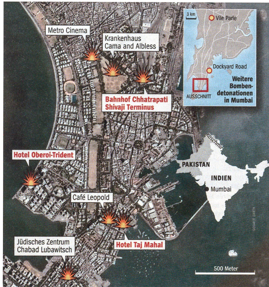
Die Terroristen griffen sieben Ziele an. Die Stadt Bombay ist nach drei Seiten offen.

In der Nacht zum 27. November 2008 gibt ein im Hotel Oberoi verschanzter Terrorist dem indischen Fernsehsender India Television ein Telefoninterview. Alle in Indien inhaftierten Islamisten mussten sofort freigelassen werden. «Ihr habt uns Unrecht