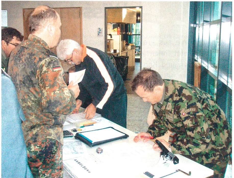
Das OK des Jura-Patrouillenlaufs bei der Arbeit.