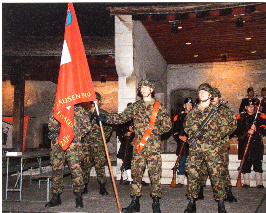
Die neue Fahne des KUOV Zürich und Schaffhausen auf dem Munot.

Am Samstag, den 17. Januar 2009 findet in Bäretswil die 65. Austragung des Bachtel-Winterwettkampfes statt. Ab 10 Uhr läuft der Wettkampf, Besammlung ist im Schulhaus Maiwinkel. Die detaillierte Ausschreibung ist unter www.uovzo.ch abrufbar. ah. ☐