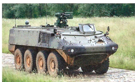
MOWAG Piranha V.

Das CCV ist ein stark gepanzertes und bewegliches Fahrzeug mit einem Gewicht zwischen 30 und 40 Tonnen, welches nicht über die Hauptbewaffnung eines Kampfpanzers verfügt, jedoch die Besatzung oder andere bei einem vergleichbaren Schutz transportiert und mit verhältnismässig leichten Waffen den Kampf gegen einen Gegner aufnehmen kann. Beabsichtigt wird der Aufbau auf einem Radfahrzeug, um hohe Beweglichkeit mit konstruktionsbedingten Vorteilen kombinieren zu können. Das zweite geforderte Fahrzeug ist ein Tactical Armoured Pat-