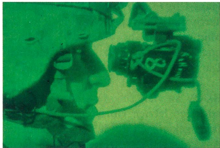
Vexierbild: Soldat mit Nachtsichtgerät.

ITT hat vom britischen Verteidigungsministerium einen Auftrag über rund 23 Mio. $ für Lieferung und Unterhalt von sogenannten HMNVS (Head Mounted Night Vision Systems) erhalten. Das HMNVS ist die britische