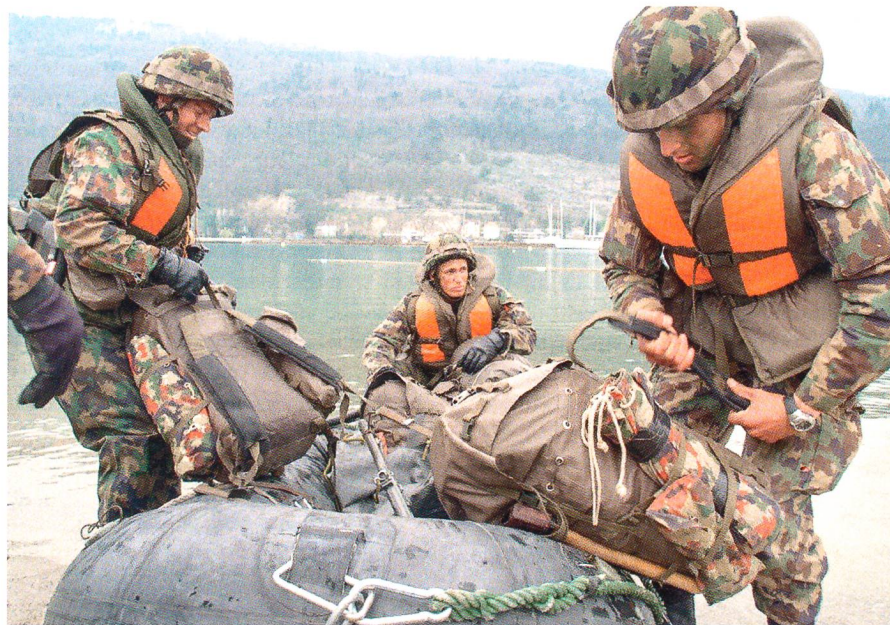
Unteroffiziere der Infanterie nach anstrengender Bootsahrt.

Erlauben Sie mir nun, eine kurze geschichtliche Klammer zu öffnen: Wenn man das vergangene Jahrhundert in 4 Teilabschnitte von 25 Jahren unterteilt, stellt man