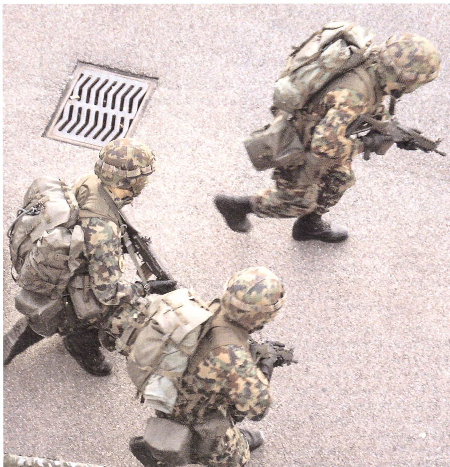
Die Werte der Infanterie: Mut, Sinn für das Gemeingut, Respekt vor dem Auftrag.

Die Unteroffiziere und Subalternoffiziere sollen Gegenstand einer besonderen Aufmerksamkeit sein, weil Sun Tsu bereits sagte: «Das Manöver auf kleinster taktischer Stufe am Boden ist es, das entscheidend zum Erreichen der strategischen Wirkung beiträgt.»