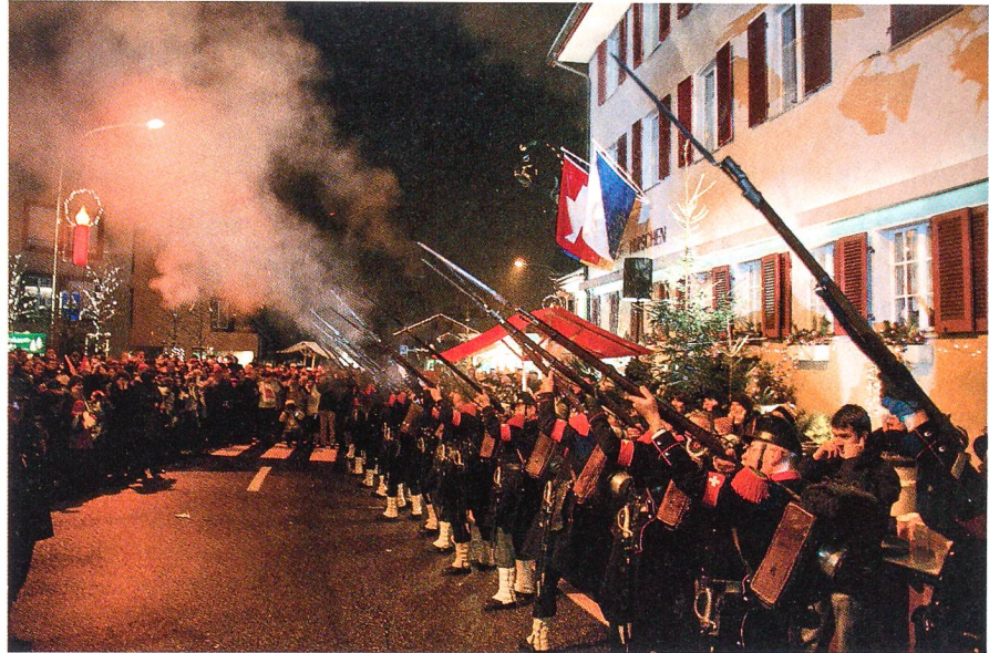
«Feuer frei!» zu Ehren von Bundesrat Maurer.