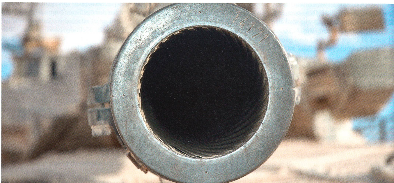
Details der 105-mm-Kanone eines Merkava II. Die Kanone wird über ein sechs-Schuss-Magazin geladen.