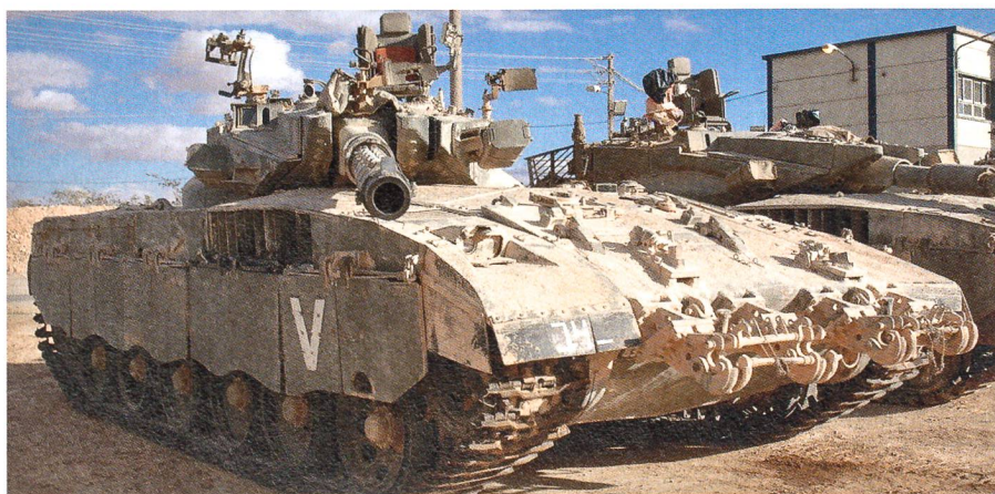
Seitenansicht des Merkava II an der Panzertruppenschule. An der Wanne befindet sich die Aufnahme für Pioniergerät. Seitlich sind die Nebelwurfbecher IMI CL-3030 verbaut.