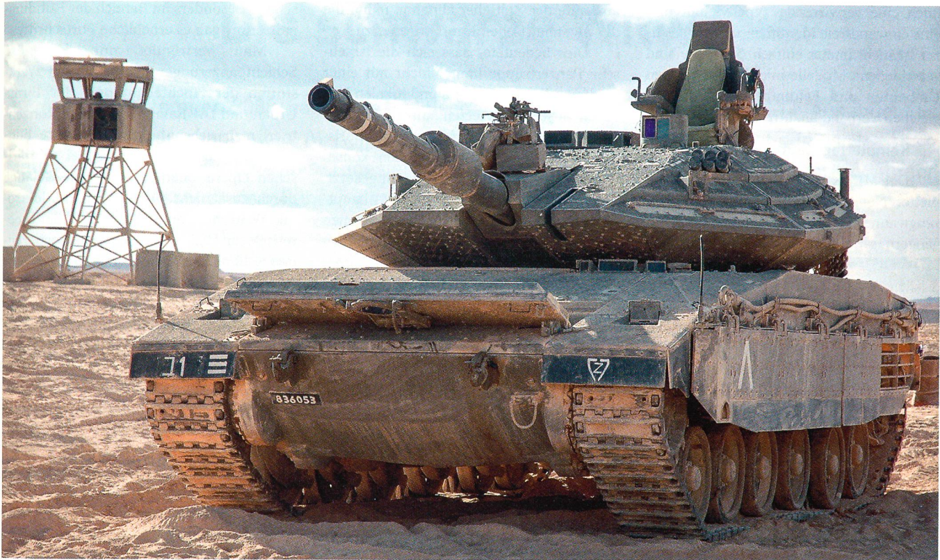
Der Merkava IV ist die aktuelle Variante der erfolgreichen israelischen Panzerserie.

Einsatz bewährt. Die Lehren aus dem Libanon-Krieg im Jahr 1982 liessen schnell eine Weiterentwicklung des MERKAVA zu.