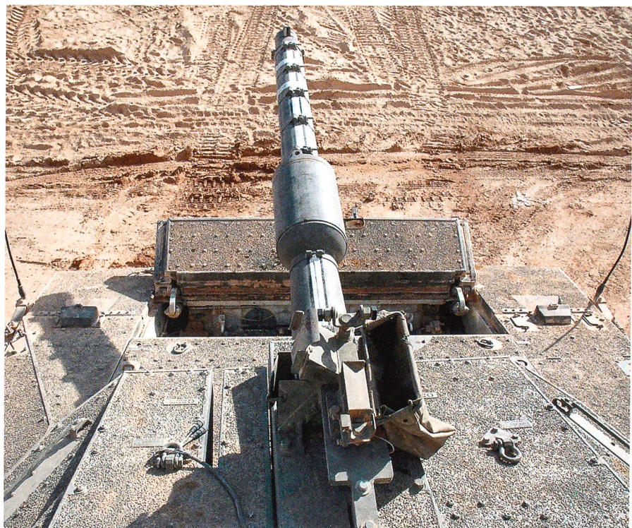
Über der 120-mm-Kanone kann ein .50-cal-Maschinengewehr für den Kampf in urbanisiertem Gebiet verbaut werden. Man beachte dazu rechts den Hülsenfang für die 12,7 mm x 99 Patronen. Vorne befindet sich die geöffnete Motorabdeckung.

Trotz aller Anstrengungen der IDF, wurde der MERKAVA II ebenfalls schnell an seine Leistungsgrenzen gedrängt. Die Laminat-Panzerung war zwar gut, aber die potenziellen Gegner verfügten immer mehr