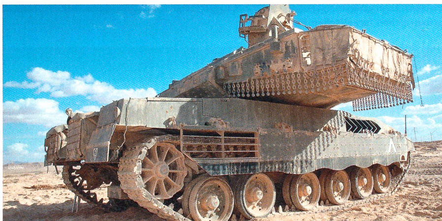
Seitenansicht des Merkava IV mit gedrehtem Turm. Viele Details wie zum Beispiel die «Ball-and-Chain»-Schutzketten an der Turmunterseite können so erkannt werden.