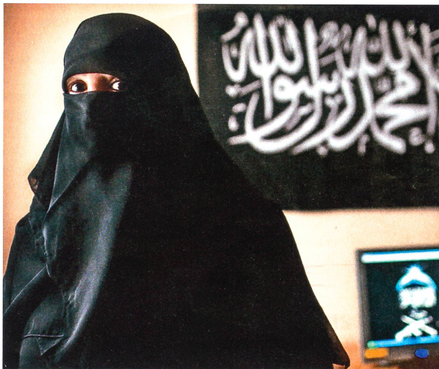
Malika el-Aroud, die schwarze Witwe, tief verschleiert.

Im Dezember 2001 liess sie sich von der belgischen Botschaft ausfliegen. Der belgische Geheimdienst liess verlauten: «Wir haben sie aus Afghanistan herausgeholt, weil wir hofften, dass sie mit uns zusammenspannen würde.» Doch daraus wurde nichts. Malika el-Aroud betrieb den