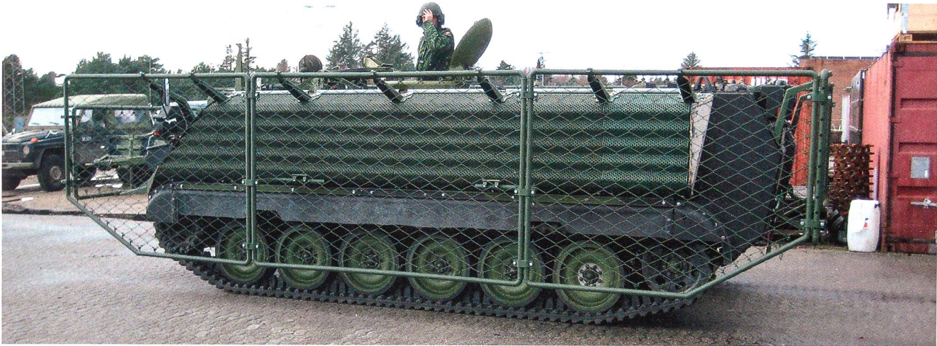
Gut sichtbar sind die am Schützenpanzer M-113 angebrachten Drahtgitter, welche einen guten Schutz gegen den Beschuss mit Panzerabwehrwaffen bieten.

Firma, womit die Kapazität in Forschung, Entwicklung und Testen von Schutzprodukten wesentlich verstärkt wird.