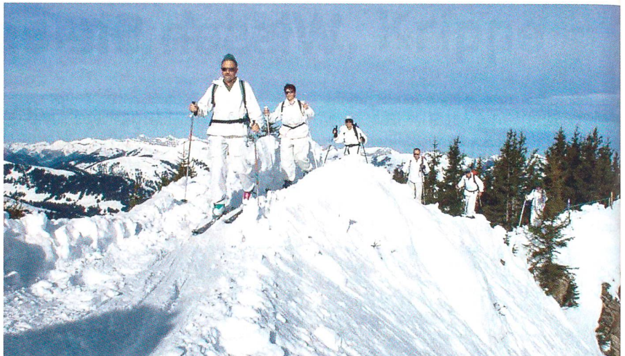
Am 14./15. März 2009 findet der 47. Winter-Zweitage-Gebirgs-Skilauf statt.

Die Unfallversicherung ist grundsätzlich Sache der Teilnehmer. Läufer, die der Schweizerischen Armee angehören oder