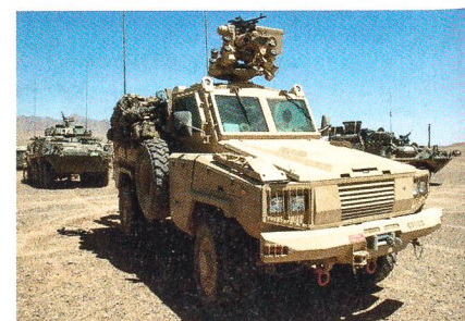
Kanadischer RG-31 in Afghanistan.

Frankreich und die USA befinden sich zur Zeit in Verhandlungen über die Miete von 100 geschützten Fahrzeugen des Typs RG-31 für die französischen Truppen, welche sich in Afghanistan befinden. Das Angebot der USA kam im Anschluss an den Geschäftsabschluss über den Kauf von fünf Fahrzeugen des Typs Buffalo, welche zur Räumung von Strassen