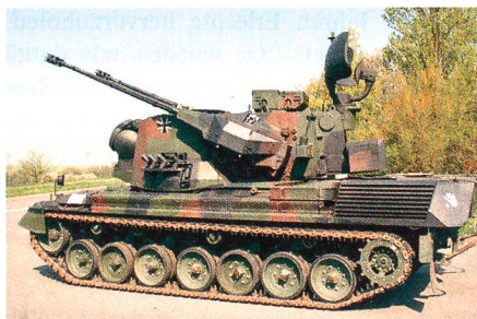
Fliegerabwehrpanzer «Gepard» der Bundeswehr.

Die chilenischen Streitkräfte haben die ersten fünf von insgesamt 30 Fliegerabwehrpanzern des Typs Gepard 1A aus Überbeständen der Bundeswehr erhalten. Die Fahrzeuge sollen lokal überholt und aufgerüstet werden. Neben einem neuen Feuer-