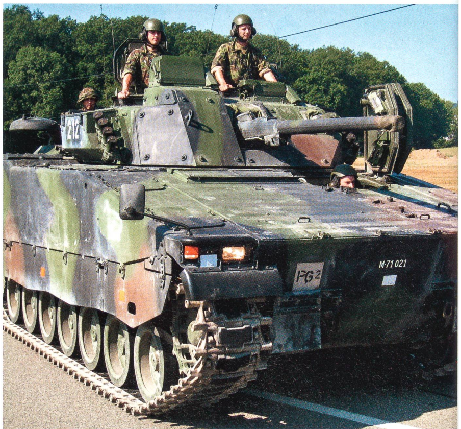
Panzergrenadiere der Panzerbrigade 11 defilierten am 27. August 2008 in Winterthur.

In einer Übung wurde das Material absichtlich in Bière gelassen: «Doch die Logistikkbasis Hinwil lieferte einen zweiten Materialsatz, der zeitgerecht eingebaut wurde. Unsere Armee ist eindeutig unterfinanziert. Als ich noch Leutnant war, erhielten wir das Material ab Wunschliste perfekt geliefert. Wir schöpften noch aus dem Vollen.