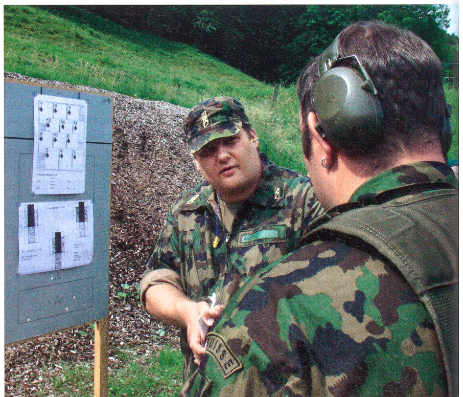
Ausbildung für die Ausbilder: Die Technischen Leiter des SUOV sind dank stetem Training auf aktuellem Stand.