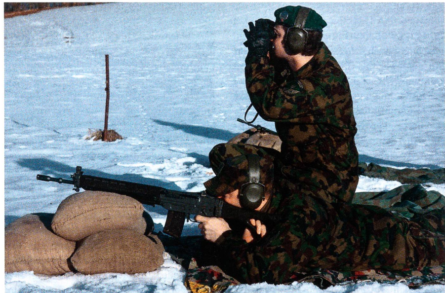
Anspruchsvoller Schiesswettkampf: Total acht Treffer auf Zeit.