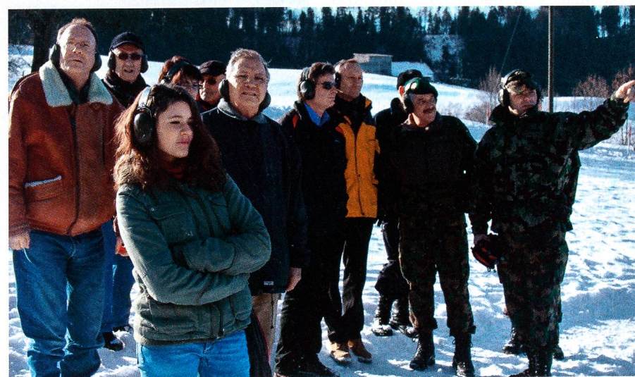
Die illustre Gästeschar verfolgt aufmerksam das Wettkampfgeschehen.