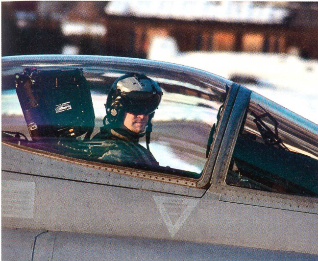
Konzentriert im Cockpit: Ein Pilot in Sion.