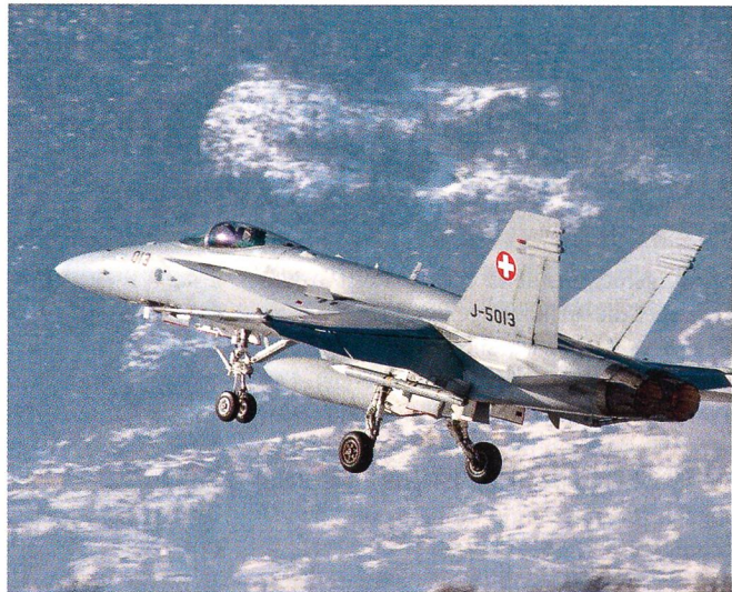
Ein F/A-18 vor den Walliser Bergen.