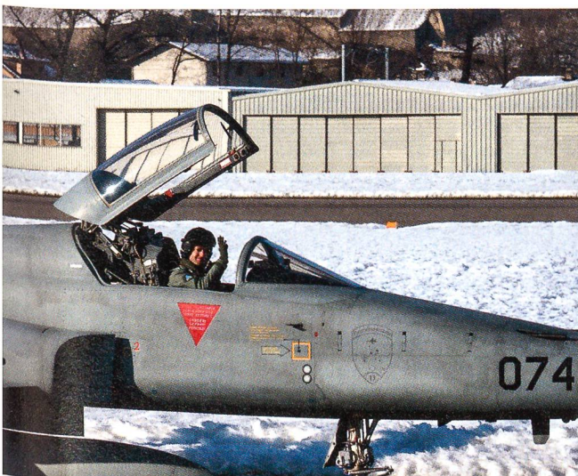
Auch der Tiger F-5 stand im WEF-Einsatz.