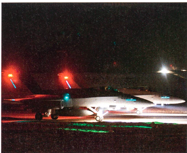
Die Luftwaffe schützt das WEF Tag und Nacht.