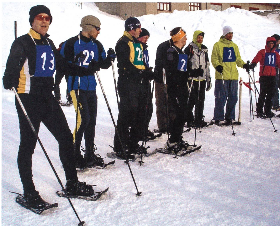
Schneeschuhläufer vor dem Start.

Leider stand das Wetterglück nicht ganz auf der Seite des Militärsportkurses. Einerseits konnte man sich zwar über die grosse Neuschneemenge freuen, andererseits musste aufgrund der unglücklichen Wetterverhältnisse und damit des erhöhten