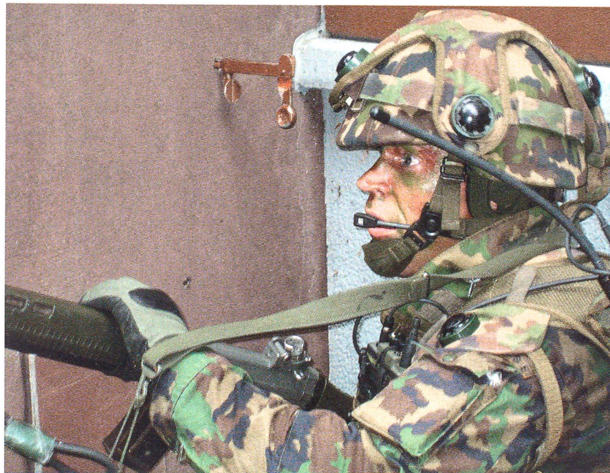
Die Schweizer Armee muss sich auf das gefährlichste Szenario vorbereiten.

Der Aufstieg neuer Religionen lässt sich auch in unserem Land nicht ignorieren. In Madrid und London ist der Kampf gegen die westliche Gesellschaftsordnung eskaliert. Ich meine: Die Schweiz ist vor solchen Bedrohungen nicht gefeit; auch wir können das Ziel von Extremisten werden.