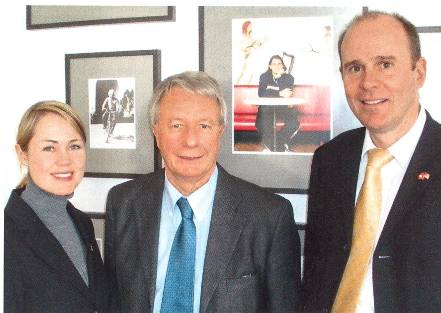
Besuch in Washington: Nationalrätin Natalie Rickli, Botschafter Urs Ziswiler und Nationalrat Thomas Hurter.

Die in der Schweiz bezahlten Steuern liegen im Übrigen einiges über dem Durchschnitt der OECD-Staaten. Wir haben auch dargelegt, dass das schweizerische Steuersystem auf dem Grundsatz der Selbstdeklaration basiert. Dem Bankgeheimnis liegt der Schutz der Privatsphäre des Individuums zugrunde, weshalb es korrekt eigentlich Bankkundengeheimnis heisst. Das forsche Vorgehen des US-Justizdepartements wurde teilweise auch auf amerikanischer Seite als