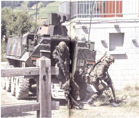
Eine Infanteriegruppe springt kampfbereit am Radschützenpanzer Piranha.