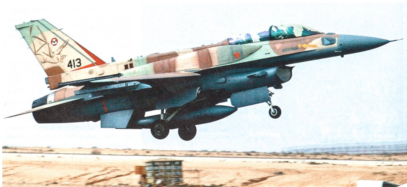
Ramon, ein grosser israelischer Luftstützpunkt, liegt im Negev: Ein F-16 hebt von Ramon aus ab, gut mit Raketen bestückt.