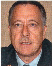
Korpskommandant André Blattmann Chef der Armee

Geschätzte SCHWEIZER SOLDATEN, für die Gratulation und die guten Wünsche zu meiner Ernennung zum Chef der Armee danke ich sehr herzlich. Ich freue mich, meine Arbeit zugunsten der Armee und unseres Landes in dieser Funktion weiterführen zu dürfen. Und danke für Euren feinen Beitrag an eine gute (die beste) Schweizer Armee.