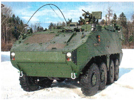
Auch die Kreuzlinger Firma MOWAG würde von einem Exportverbot direkt betroffen.

Damit können Güter, die sowohl zivil als auch militärisch verwendet werden, weiterhin exportiert werden. Dies ist jedoch trügerisch. Bei einer Annahme der Initiative dürften sogenannte «besondere militärische Güter» nicht mehr exportiert werden. Darunter fallen hochwertige Produkte wie zum Beispiel Simulatoren, Messgeräte, Wärmebildkameras, Chiffriergeräte und ähnliches.