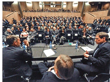
Blick ins Publikum.

Anreizsystemen zur Erreichung der Ziele, von unanständigen oder gar gesetzeswidrigen Geschäftspraktiken und von einem unrealistischen Wachstumswahn, der zu ei-