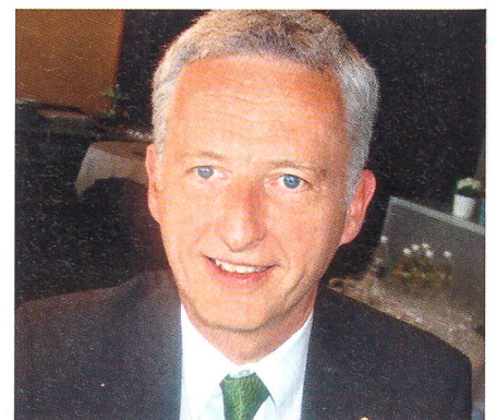
Regierungsrat Hanspeter Gass, Baselstadt, wurde in den Vorstand gewählt.

den Verbesserungen bei der Ausbildung angestrebt. Zum anderen soll die Schutzraum-Baupflicht angepasst werden, wie dies insbesondere von politischer Seite in jüngster Zeit verschiedentlich gefordert worden ist.