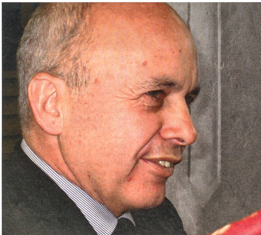
Bundesrat Maurer: «Das Berufsmilitär ist ein wesentliches Element.»

➤ Mittlerweile wissen wir auch, dass das Schweizervolk über die Heimabgabe der persönlichen Waffe abstimmen wird. Wie beurteilen Sie die Aussichten der Initiantinnen und der Gegner des Vorstosses, der «das Gewehr im Schrank» verbieten will?