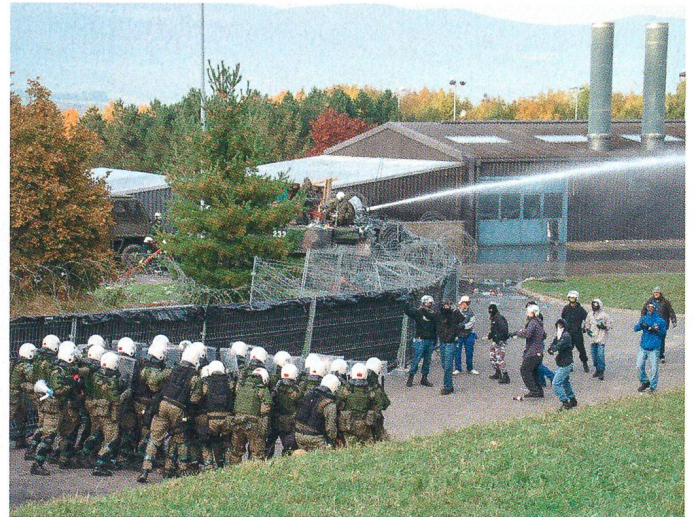
Einsatz gegen Randalierer.

Besatzung mit dem schweren Bord-Mg 12,7 mm. Den Höhepunkt des Tages bildete die Durchführung einer Angriffsaktion einer verstärkten Infanterie-Kompanie.