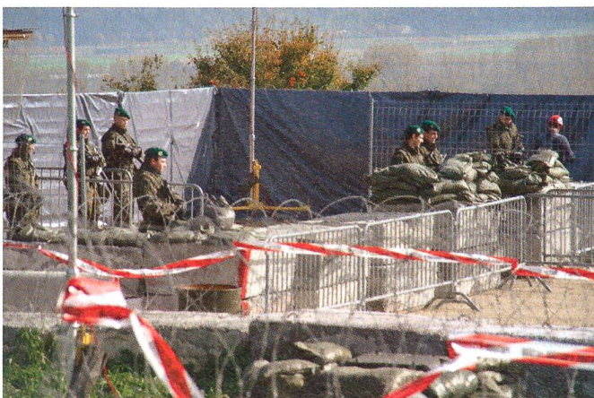
Auf dem Waffenplatz Chamblon Süd.

Standort: Waffenplatz Chamblon Süd. U Anlage: Grosser Grenzübergang für Fahrzeuge und Fussgänger. Mittel: Infanterie Zug mit Spz 93 (Piranha), Militärpolizei-Detachment mit Hundeführer, Grenz-