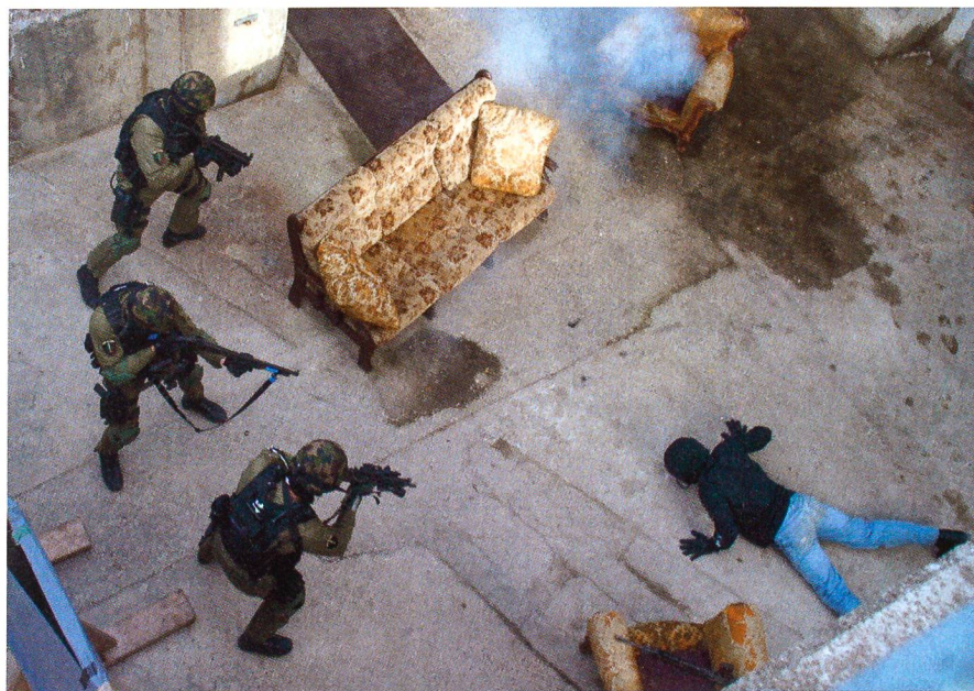
In der Ortskampfanlage Le Day.

Den Abschlusstag des European Infantry Seminary gestaltete die Infanterieschule Bière. Hier wurden die Teilnehmenden mit der Ausbildung der Schützenpanzer-Besatzungen (Piranha 2) bekannt gemacht. Vorgeführt wurden die Simulator-Anlagen für die Spz-Fahrer und für das Schiessen der