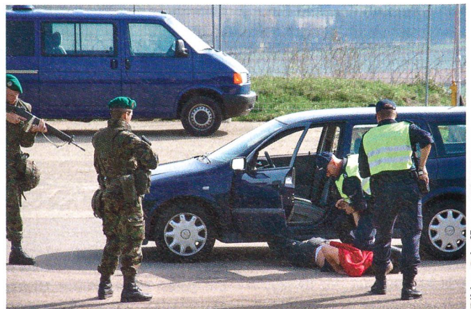
Der Terrorist wird überwältigt.