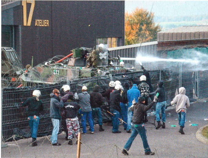
Auf dem Waffenplatz Chamblon Nord.