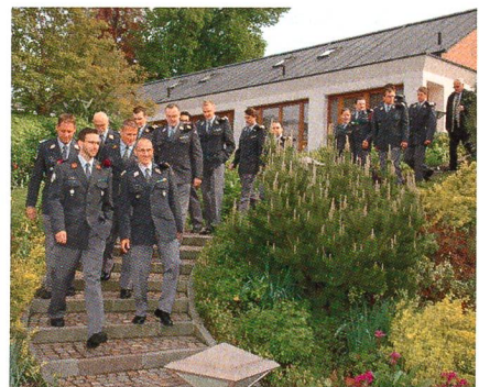
Die «Silbergrauen» im Anmarsch (VBA Telematik 61, Frauenfeld).

muss erhalten bleiben. Man muss sich einmal bewusst sein, was mit einer Annahme der Initiative verbunden ist.