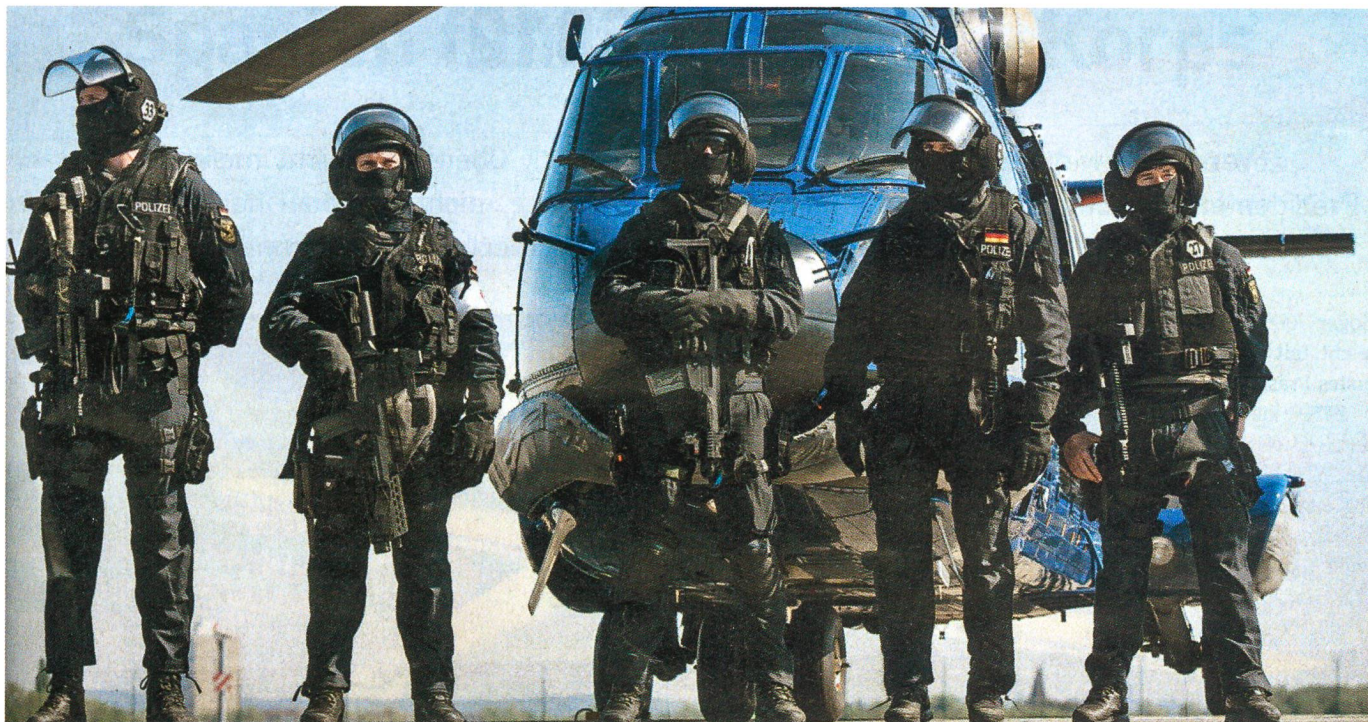
Kämpfer der GSG 9, wie immer vermommt, mit einem Einsatzhelikopter.