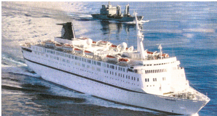
Ein spanisches Schiff geleitet den Kreuzfahrer «Melody» ins sichere Gewässer.

Wer hat das italienische Kreuzfahrtschiff «Melody» gerettet? Neun Seeräuber hatten gut 700 Seemeilen von Somalia entfernt versucht, die «Melody» mit ihren 1000 Passagieren zu entern.