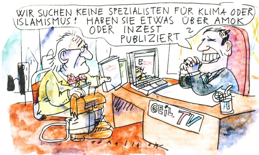
Vorstellungsgespräch beim Fernsehen.