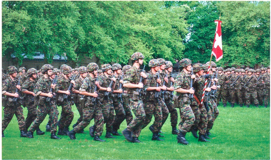
Das schwungvolle Hauptquartierbataillon 25 bei der Standartenübernahme.

Er begrüßte seine Soldaten: «Viele neue Kameradinnen und Kameraden aus anderen Waffengattungen wurden uns zugeteilt. Für einige der neu Eingeteilten ist ein Hauptquartier Neuland – es gibt viel