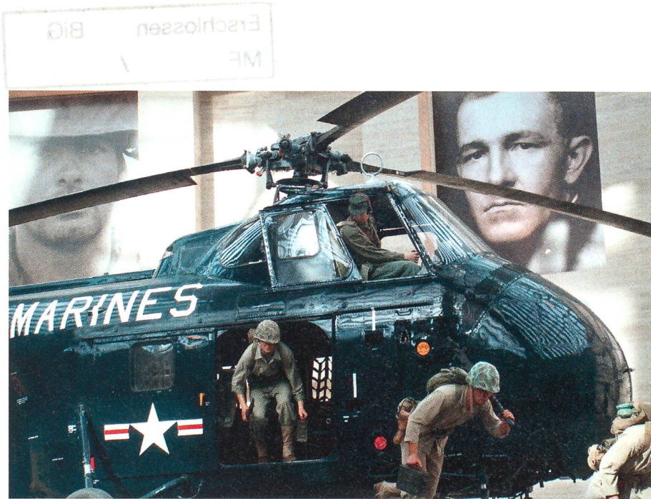
In der Haupthalle des Museums wird dieser Sikorsky Helikopter H-19 gezeigt, wie er im Koreakrieg Marines zu einem Gefecht absetzt.

Oberst i Gst Jürg Kürsener, Lohn-Ammannsegg, ist Chefredaktor der Military Power Review. Für den SCHWEIZER SOLDAT schreibt er seit Jahrzehnten über Marinetheemen.