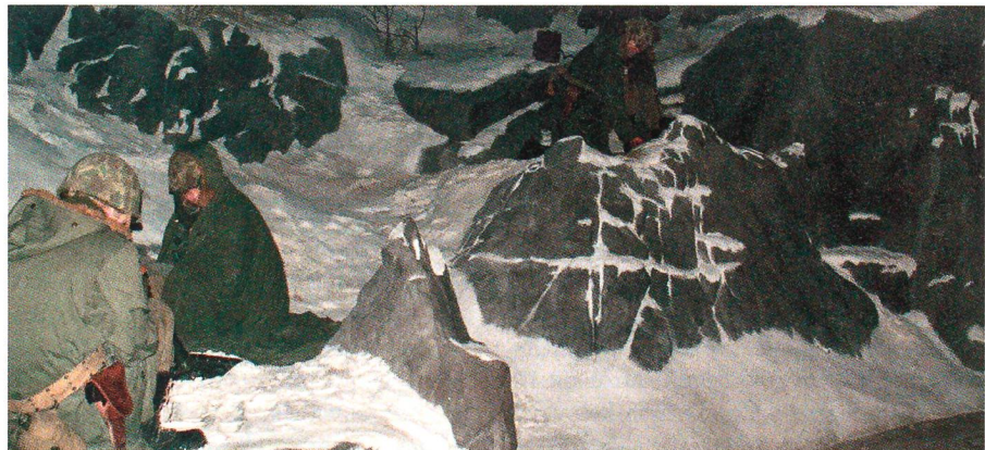
In bitterer Kälte kämpften die Marines auf äusserst tapfere Art und Weise während des Koreakrieges in der Schlacht vom «Chosin Reservoir» gegen die Chinesen.