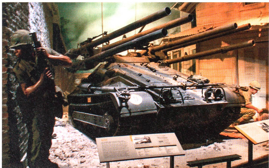
Ein Leichtpanzer der Marines vom Typ «Ontos» wird mit sechs 106 mm rückstossfreien Rohren (bei uns in den 60er Jahren in den Pzaw Kp der Inf Bat als BAT auf Jeeps im Einsatz) in der Schlacht von Khe Sanh in Vietnam im Einsatz gezeigt.