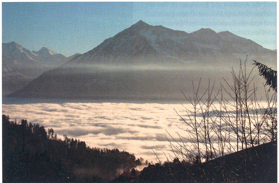
Selbst Nebelschichten dieser Dichte sind für das Radarsystem SAR kein Problem.

Neben der Eigenschaft der Wetterunabhängigkeit liefern SAR-Systeme Beiträge zur Informationsüberlegenheit. Mit der Zusatzoption GMTI (ground moving target indication) ist es möglich, Fahrzeuge und ihre Fahrtrichtung innerhalb eines Gebietes