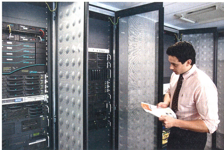
Immer mehr Bedeutung gewinnt die Konzentration auf Kernkompetenzen.

Die privaten Unternehmen haben bei bestimmten Projekttypen bereits langjährige Erfahrungen zur optimalen Gestaltung und können daher die vorhandenen Projekt- und Betriebsrisiken und -chancen besser einschätzen, sodass durch PPP insgesamt eine wirtschaftlichere Leistungserbringung im Interesse aller erreicht werden kann. Durch die Reorganisation der Bun-