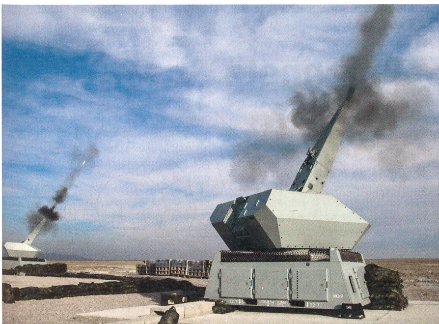
Zwei Geschütze des Systems NBS C-RAM beim Bekämpfen von ungelentkten Raketen. Verschossen wird die programmierte Ahead-Munition, welche die Zerstörung der anfliegenden Flugkörper in der Luft erlaubt.

Es ist geplant, dass das Camp Kunduz in Afghanistan ab 2011 von NBS C-RAM geschützt ist. Das zweite bewilligte System wird in Deutschland für die Ausbildung eingesetzt. +