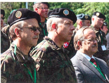
Div Roberto Fisch, KKdt André Blattmann und alt Bundesrat Samuel Schmid.