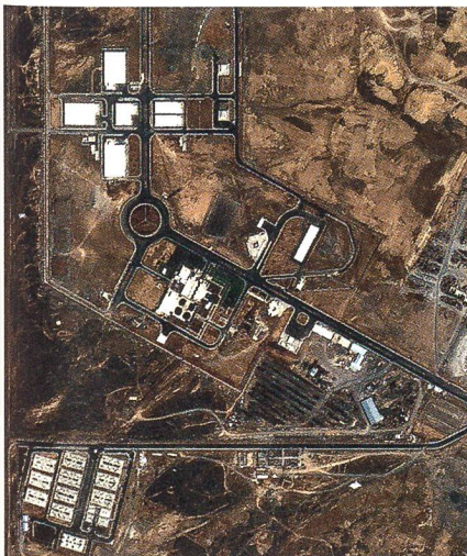
In Natans wird Uran so angereichert, dass es für die Bombe geeignet ist.