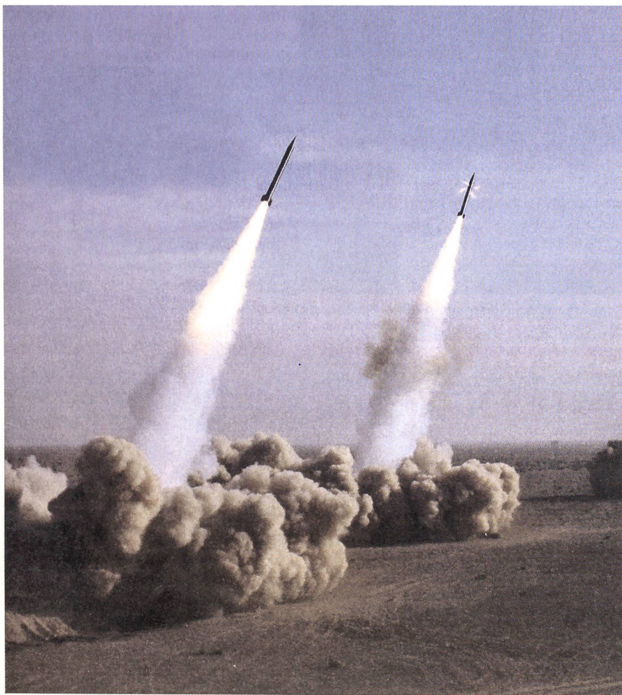
Raketentest in der Wüste bei Qom. Die Raketen reichen 2000 Kilometer weit.

Ausländische Geheimdienste wissen viel über die Zentrifugen-Kaskaden in der Atomanlage Natans und die geheimen Beschaffungen der Perser. Sie errechnen, in welchem Zeitraum Teheran wie viel waffen-