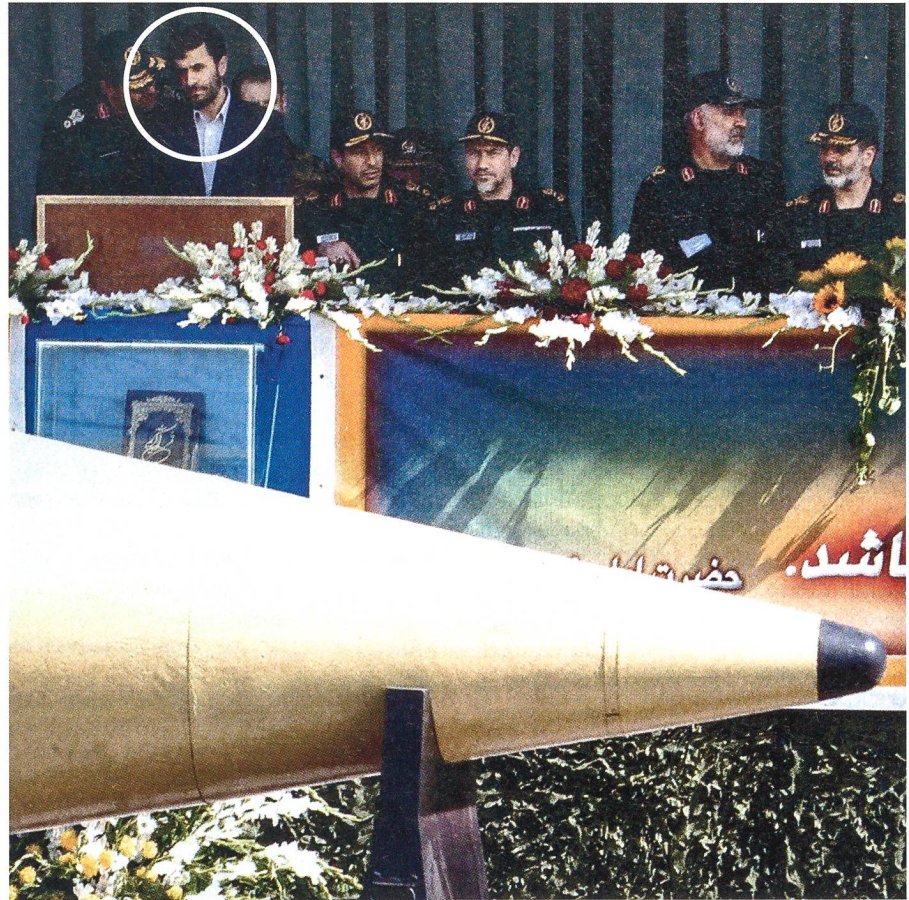
Präsident Ahmadinedjad nimmt eine Parade ab. Vor ihm eine Shahab-3-Rakete.

Der Bayer fliegt am anderen Tag mit dem Flug TK 1579 nach Düsseldorf. Dort schlagen die Beamten des Zollkriminalamtes zu: Sie verhaften den Bayern auf der Stelle. Und schon glauben die deutschen Ermittler, den nächsten Fisch an der Angel zu haben: Ali Alaei, iranisch-kanadischer Doppelbürger, Chef der Import-Export-