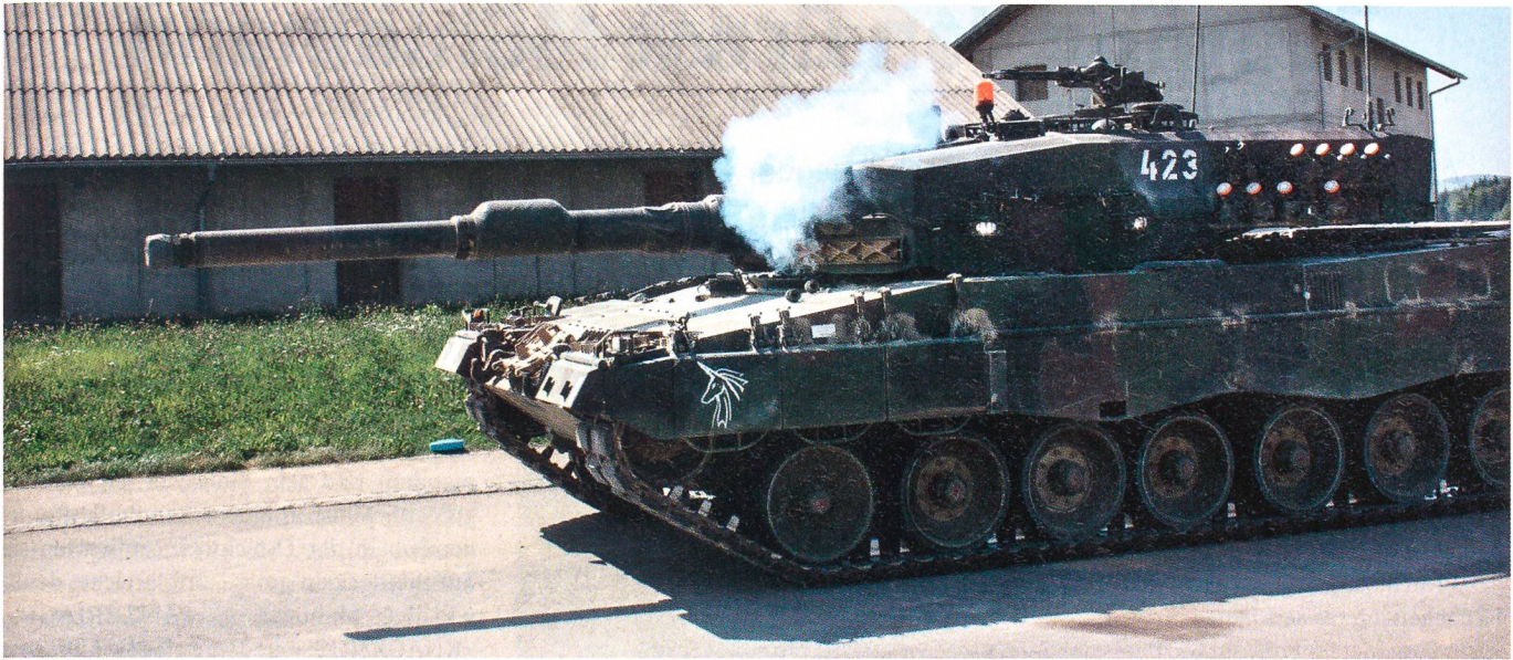
Im Ortskampfdorf Nalé, 19. August 2009: Ein Leopard-Panzer der Panzerkompanie 28/4 stösst ins Dorfzentrum vor.

zeuge ist ein eigener Pool im Aufbau, der im Endausbau 227 Radschützenpanzer Piranha, 66 Kampfpanzer Leopard und 45 Schützenpanzer 2000 umfassen wird. Dazu kommen Aufklärungs- und Schiesskommandanten-Fahrzeuge. Auch Lastwagen und Sanitätsfahrzeuge werden eingebunden.