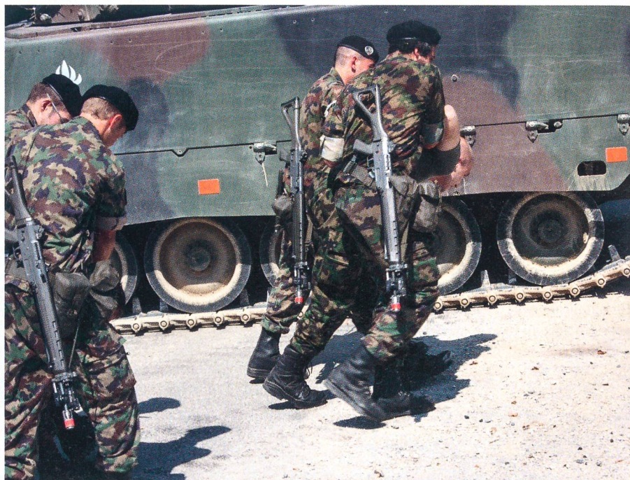
Mechanisierter Checkpoint: Panzergrenadiere führen gefangene Terroristen ab.

Was ist SIMKIUG? Lassen wir Oberst Hans-Ruedi Schaffhauser, unseren bewährten Baselbieter Korrespondenten, sprechen. Er schreibt: «Die Simulatorsysteme überwachen, erfassen, analysieren und unterstützen in allen Funktionen das Gefecht der verbundenen Waffen bis ins kleinste Detail. Zielsetzung ist die möglichst wirk-