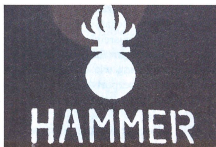
Das Motto der Pz Gren Kp 28/2: HAMMER steht für Hingabe, Anstand, Mut, Motivation, Ehrlichkeit, Respekt.

Da könnte ihm niemand erklären, weshalb die Brigade bald Unterbestände aufweisen werde. Das sei doch nicht zu verstehen, wo die Brigade jetzt einen Überbestand von fast 4000 Mann habe.