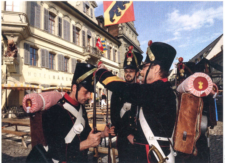
In den Strassen von Langenthal: Erinnerung an 1822.

Pointiert warnte Blattmann davor, sich in trügerischer Sicherheit zu wiegen: «Haben Sie vor zwei Jahren ihre Aktien verkauft?» Und kritisch legte der Chef der Armee den Finger auf die Probleme in der