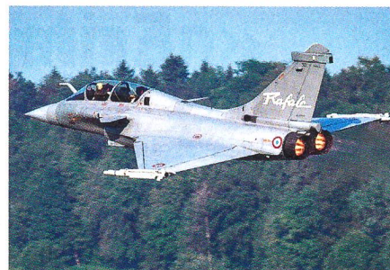
Bewerber 3: Der Rafale aus Frankreich.

wonach die 15 Kampfflugzeuge enorme Betriebskosten verursachen, die das Bundesheer nur noch mit Mühe trage.