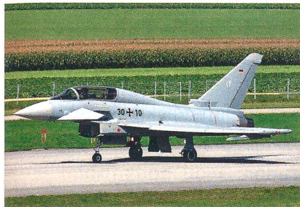
Bewerber 1 (alphabetisch): Eurofighter.