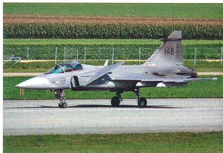
Bewerber 2: Der Gripen aus Schweden.