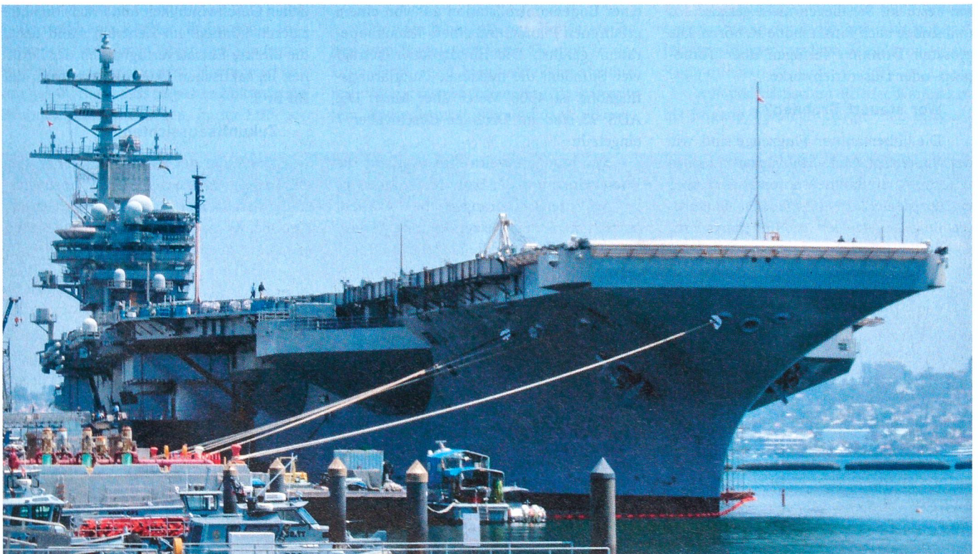
Vor dem Büro des Commander, Naval Air Forces, liegt die USS Ronald Reagan vertäut. Sie ist mittlerweile in einen Einsatz in den Westpazifik und in den Indischen Ozean gefahren.

Er hat einen Studienlehrgang am Naval War College (Systems Management) und einen am National War College (National Security Strategy) mit jeweils einem