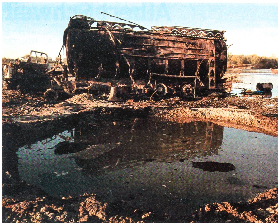
4. September 2009, bei Kunduz: Ausgebrannter Tanklastzug nach NATO-Luftangriff.

Niemand wolle, dass sich Iran Nuklearwaffen zulege, meinte auch der russische Wissenschaftler Alexei Arbatow. Nur sei es schwierig, eine gemeinsame Front aufzubauen. So sei es fraglich, ob Russland und