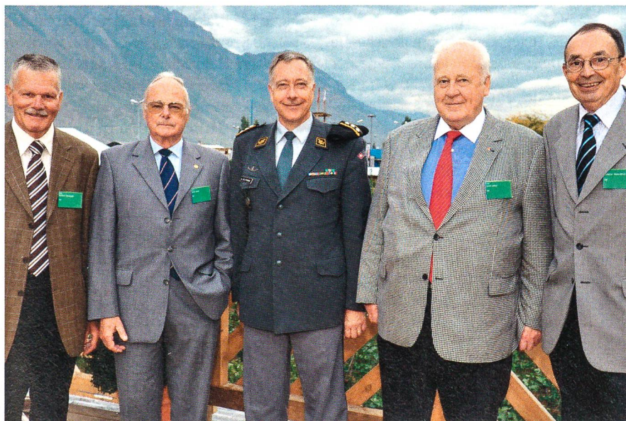
Diese fünf Männer führten (und führen) die Armee seit 1990.

Einzigartiges «Generals-Treffen» in Martigny: Am 8. Oktober 2009 lud Korpskommandant André Blattmann, der Chef der Armee, Meinungsführer aus dem Grossraum Wallis und nationale Exponenten der Armee zu einer Besichtigung der VBS-Ausstellung an der «Foire du Valais» in Martigny ein.