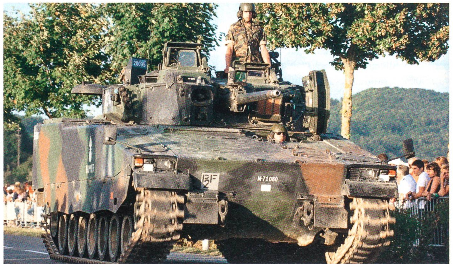
Ein Elite-Verband durch und durch: Das Ostschweizer Panzergrenadierbataillon 29.

In Hinwil leisten seit anderthalb Jahren Soldaten einen speziellen Dienst, für den sie sich aufgrund ihrer besonderen beruflichen Kenntnisse qualifizieren. Diese Soldaten werden aufgrund ihrer Fähigkeiten und ihres Wohnortes eingesetzt. Dieses Vorgehen bewährt sich in Hinwil seit dem Jahr 2008. Es gibt sogar eine schriftliche Checkliste für diesen Sondereinsatz, die mit den Soldaten besprochen und von diesen unterschrieben wird. Am 27. Oktober 2009 prangerte die Boulevardpresse das Mittagessen vom 26.