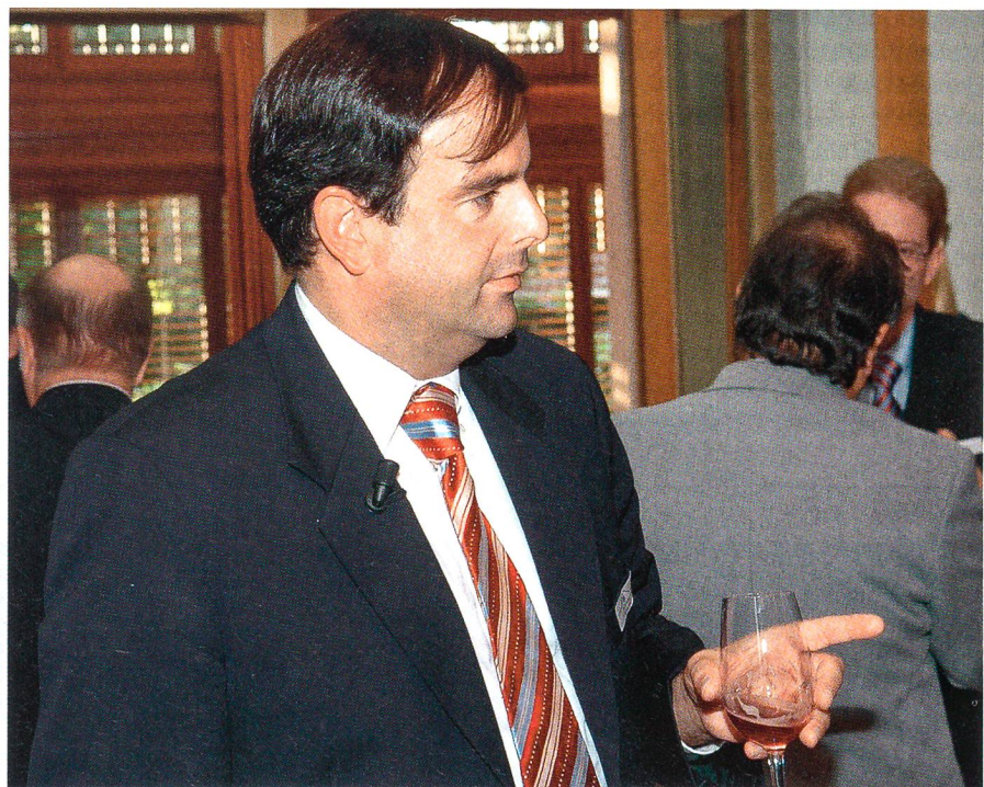
Nationalrat Gerhard Pfister: «Political correctness bedroht die Freiheit.»

Die Gründungsgeschichte der Vereinigten Staaten zeigt eindrücklich, wie man einen Staat aufbaut, der auf dem Natur-