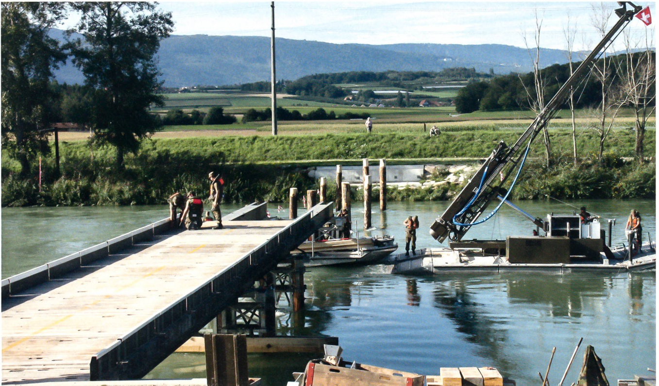
Handwerksarbeit und Truppenkönnen vom Feinsten: Bau der Stahlträgerbrücke über den Hagneck-Kanal.