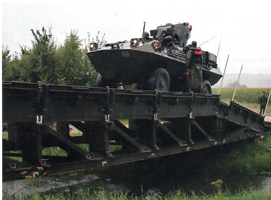
Ein Piranha der Aufklärer-RS überquert die feste Brücke 69 der Bausap Kp.