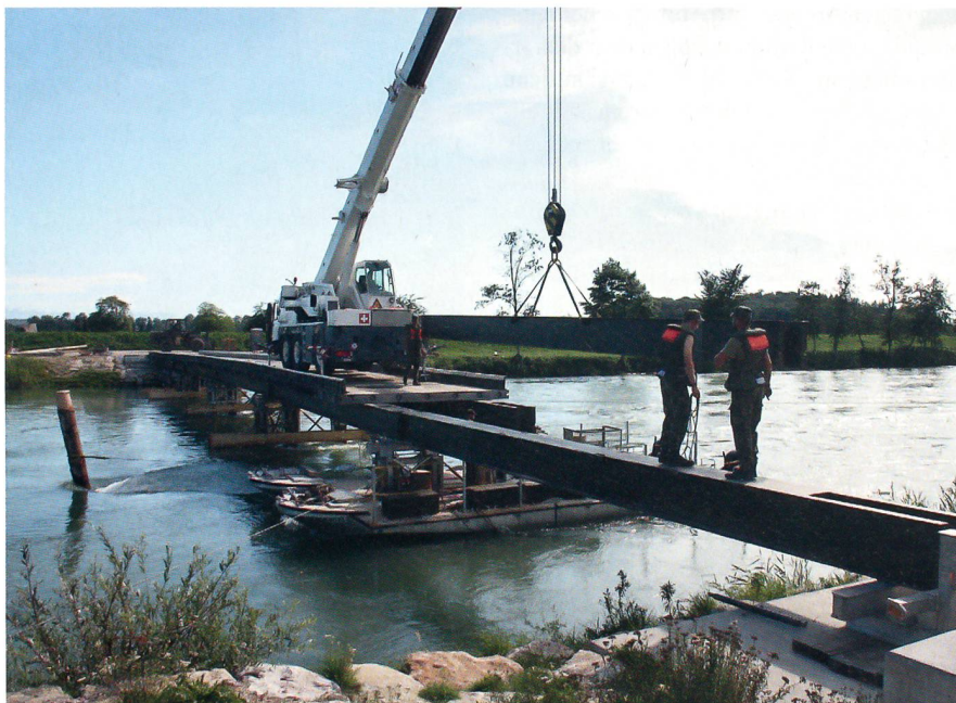
Die Bausappeurkompanie in Aktion: Bau der Stahlträgerbrücke.