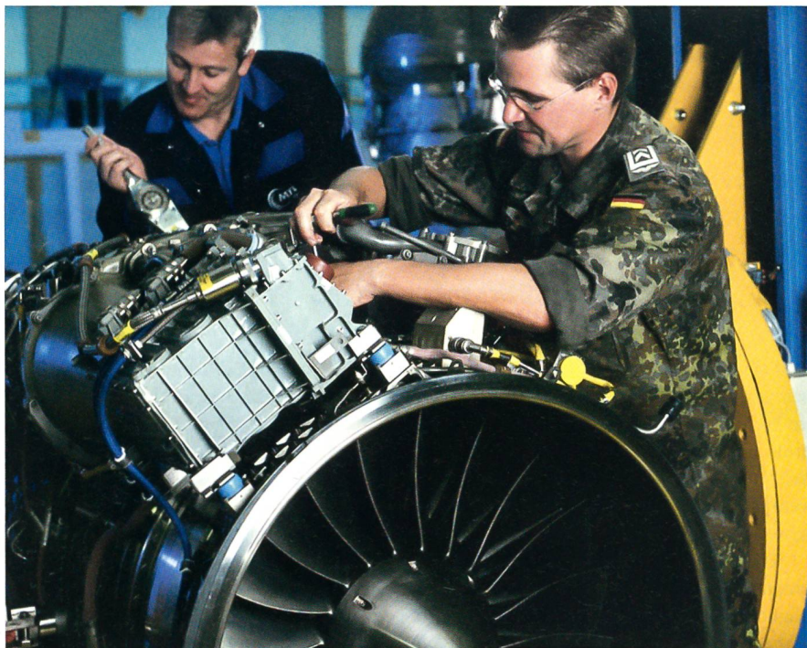
Von der Kooperation mit der deutschen Luftwaffe profitiert auch die Rüstungsindustrie.

Grössenordnung von 250 000 Soldatinnen und Soldaten an den Rand ihrer personellen und materiellen Leistungsfähigkeit bringt?