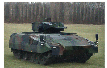
Kampfschützenpanzer PUMA, welcher die Basis für den SAIC/Boeing-Vorschlag bildet.

Der SAIC/Boeing-Vorschlag im Zuge des Ground Combat Vehicle-Vorhabens der U.S. Army basiert auf dem Schützenpanzer PUMA, von dem bereits 405 Fahrzeuge für das deutsche Heer bestellt sind. Das 42 bis 43 Tonnen schwere Fahrzeug muss jedoch verlängert werden, da der PUMA lediglich Raum für sechs Panzergrenadiere bietet, die U.S. Army aber einen Schützenpanzer für neun Mann fordert. Nach Aussage von Boeing und SAIC bildet der PUMA zwar die Grundlage, wird aber um Technologie-merkmale ergänzt, die für das «Manned