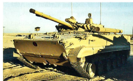
Russischer Kampfschützenpanzer des Typs BMP-3 der VAE-Streitkräfte.

Die Vereinigten Arabischen Emirate und Russland stehen in Verhandlungen betreffend der Modernisierung der Schützenpanzer des Typs BMP-3. Daneben stehen in