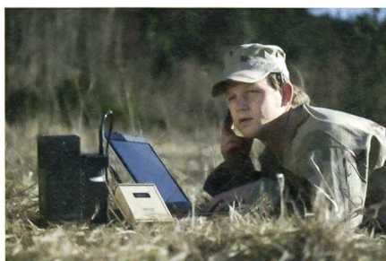
Soldat betreibt Funkgerät mit einer Brennstoffzelle.

Die Bundeswehr beschafft von der Firma SFC Smart Fuel Cell AG Brennstoffzellen für Auslandseinsätze, welche als autarke Stromerzeugungssysteme zur zuverlässigen Energieversorgung von elektronischen Geräten im Feld dienen. Bei der bestellten Brennstoffzelle handelt es sich um das Produkt JENNY, welches seit über einem Jahr als netzferne tragbare Stromquelle einge-