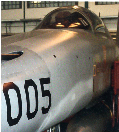
In der Rapporthalle: Der F-5 Tiger mit der Immatrikulation J-3005 – er wird noch lange fliegen müssen.