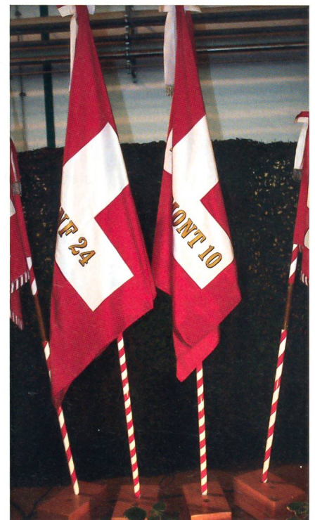
Die Feldzeichen: Aufkl Bat 10, Inf Bat 24, Geb Inf Bat 10 und FU Bat 10.

Überrascht sei sie von der Nachricht gewesen, Bundesrat Ueli Maurer wolle die Beschaffung des neuen Kampfflugzeuges zurückstellen; und noch mehr überrascht hätten sie die Aussagen des früheren Bundesrates Christoph Blocher: «Wir brauchen eine politische Führung die sagt, was sie braucht; und wir brauchen Chefs, die sagen, was sie wollen. Wir alle müssen unsere Ver-